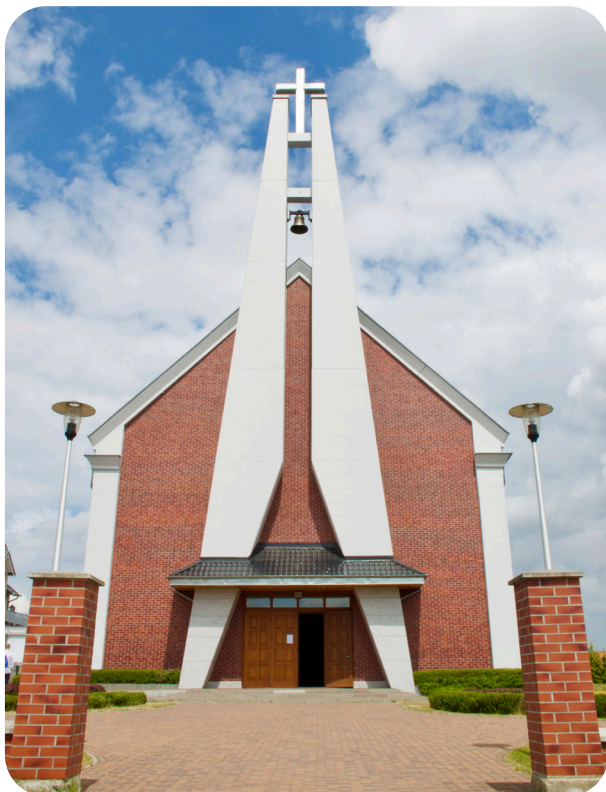
Odnowiona wieża kościoła