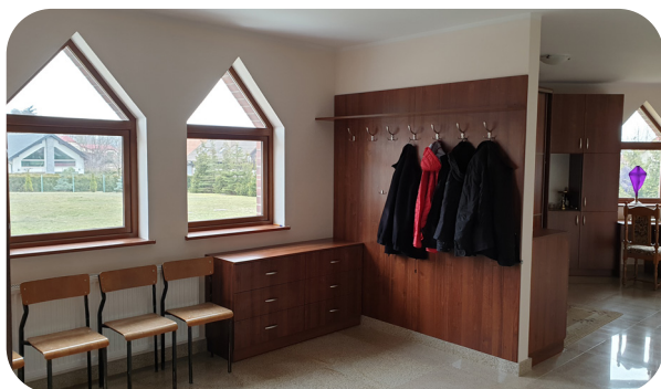
Zakrystia po remoncie