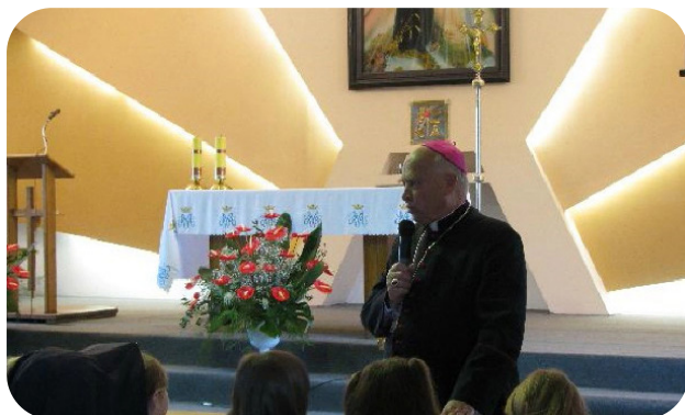
Wizytacji dokonał ks. abp Tadeusz Gocłowski .